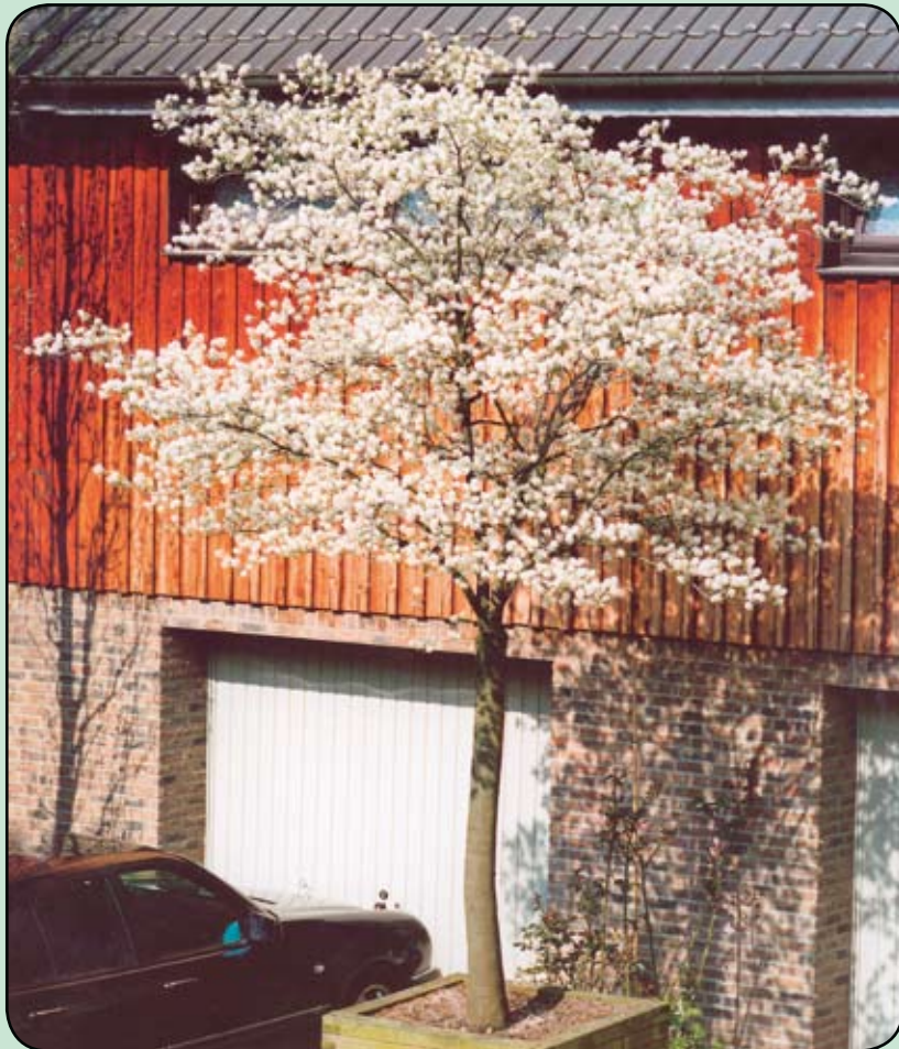
Krentenboompje (witte bloesem)