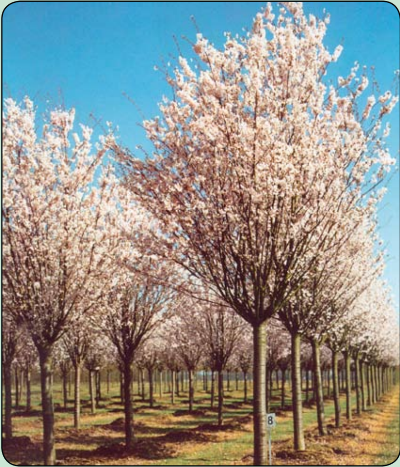
Sierkers (witte bloesem)