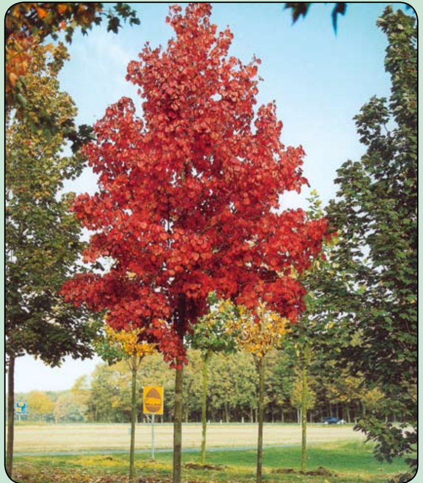
Esdoorn (rood herfstblad)