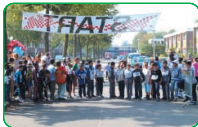
Ook afgelopen zomer organiseerde Sportservice Ede tal van activiteiten voor onder meer de kinderen uit de wijk.

Sportservice Ede ontplooit de komende tijd de nodige activiteiten in sportzaal De Essenburg in Veldhuizen A. Wat bijvoorbeeld te denken van 'Sportkids voor 5- tot 8-jarigen', waarbij kinderen iedere dinsdag van 16.00 tot 17.00 uur met sport- en spelonderdelen alle basisvaardigheden van bewegen leren. Docenten zijn Angeline en Zoulikha.