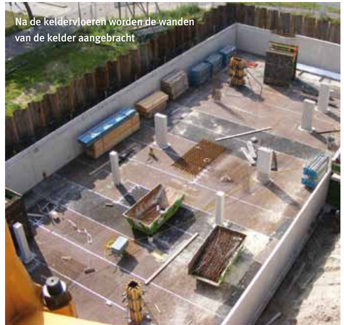
Na de keldervloeren worden de wanden van de kelder aangebracht

Aan de achterzijde van deze nieuwsbrief hebben we vijf veelgestelde vragen beantwoord. Als uw vraag er niet bij zit, neem dan gerust contact op met onze afdeling Woonservice, telefoon 695 666.