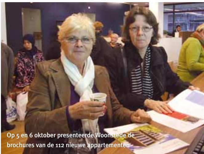
Op 5 en 6 oktober presenteerde Woonstede de brochures van de 112 nieuwe appartementen

Als alle gesprekken met terugkerende bewoners zijn gevoerd, worden de overgebleven woningen door Woonstede via de website www.huiswaarts.nu aangeboden aan de rest van WERV-regio. Dat zal naar verwachting begin volgend jaar zijn.