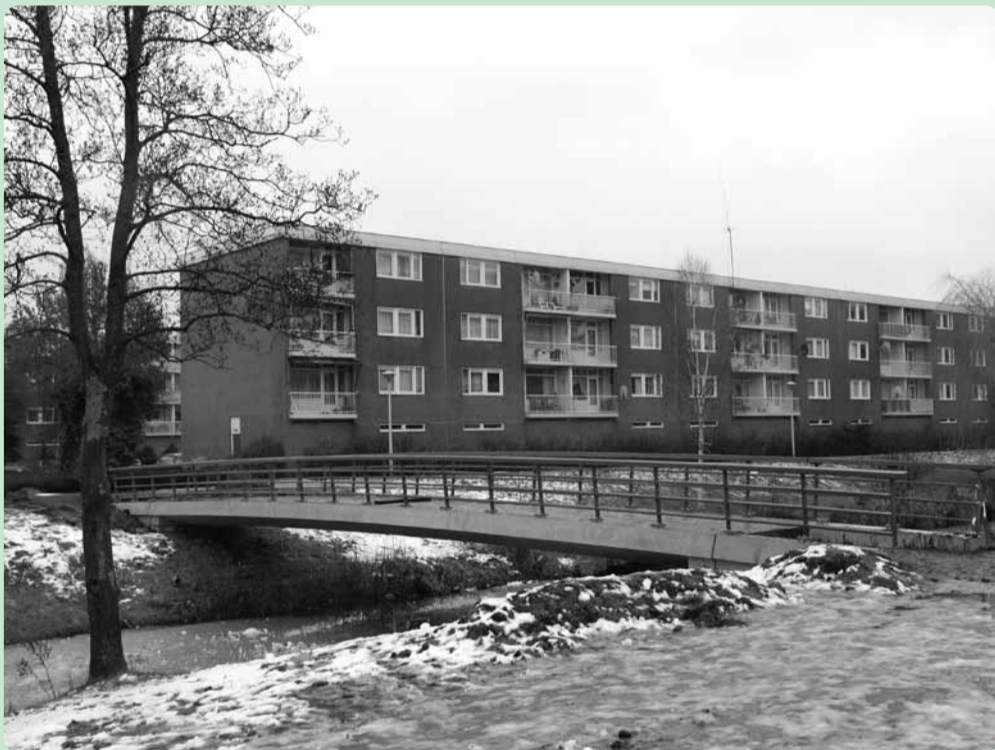
De portiekflats worden de komende jaren verder onderhouden en verbeterd.