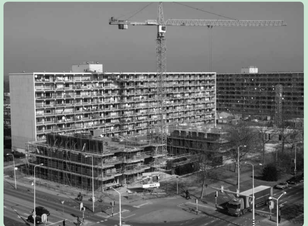
Aan de Slotlaan verrijzen vier woontorens met 112 huurwoningen. De oude Luynhorstflats worden gesloopt.